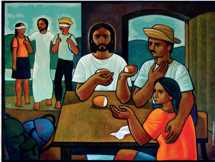
Discípulos de Emaús - Cerezo Barredo

Teu sol não se apagará, tua lua não terá minguante, porque o Senhor será tua luz, ó povo que Deus conduz!